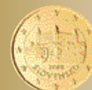
10 centov, 20 centov a 50 centov

Dvojkriž na trojvrší je erbovým znamením štátneho znaku, jedného zo štátnych symbolov Slovenskej republiky. Je rozvrhnutý do kruhovej plochy s reliéfnym pozadím štylizovaných skál, ktoré sú vyjadrením stálosti a pevnosti štátu.