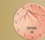
1 cent, 2 centy a 5 centov

Bratislavský hrad je charakteristickou dominantou hlavného mesta Slovenskej republiky. Je národnou kultúrnou pamiatkou a patrí k najznámejším symbolom Bratislavy i Slovenska. Do motívu hradu je zakomponovaný štátny znak, jeden z oficiálnych štátnych symbolov Slovenskej republiky.